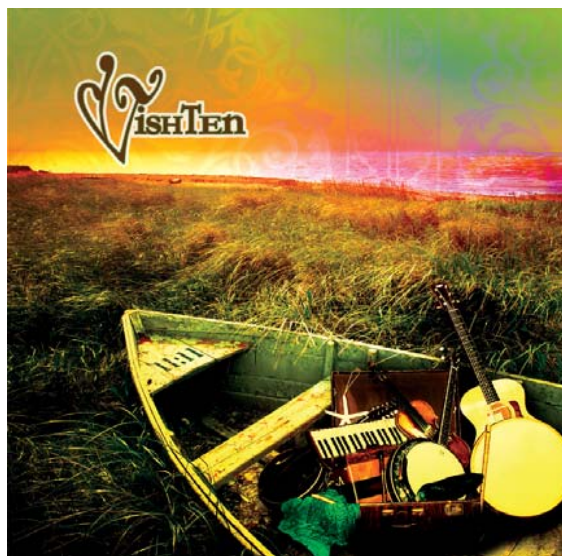
2 ème Album - 2007