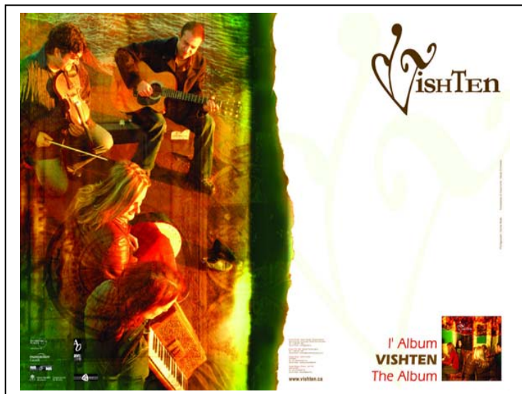
1 er Album – 2004