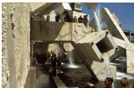
Arnaud Vaillancourt, Fontaine , 1971

À l'occasion de la commémoration de la création du Centre Canadien d'Essai à Montréal , la Maison de la Culture de Notre-Dame de Grâce à Montréal organise deux visioconférences avec le Centre Culturel Canadien en collaboration avec l' Université Européenne de la Recherche et le Séminaire ARTCOMTEC .