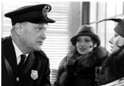
L'âge de la machine