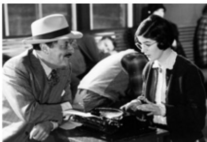
L'âge de la machine