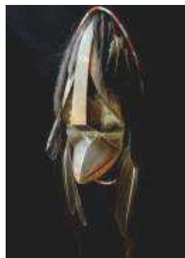
© Perry Eaton, 2008, "L'autre côté de Corbeau"

Simon Tukumi (1934-) artiste inuit de Qamanittuaq dans l'Arctique canadien (in IAQ, vol.8, n° 2, summer 1993, p. 6).