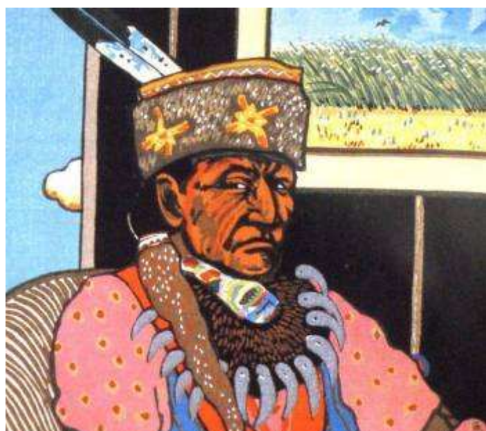
© T.C. Cannon "Osage with Vincent Van Gogh"

Comment s'affirmer comme artiste contemporain tout en demeurant fidèle à son identité et à sa culture ? Tel est le dilemme devant lequel se sont trouvés placés les artistes indiens contemporains. La présentation aura pour objectif de faire découvrir le parcours et l'œuvre de quelques artistes particulièrement talentueux qui ont su trouver leur voie, entre tradition et modernité.