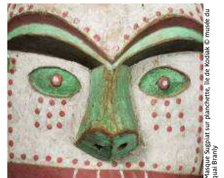
Masque Suggiat sur planchette, île de Kooliak