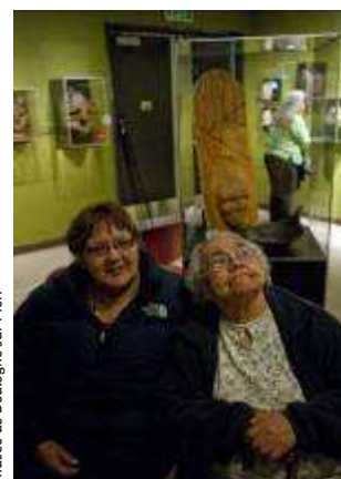
Femmes autitit découvrant les masques de la collection Pinart lors de l'exposition Qirnaquq ille u face à Kodiak, 2008