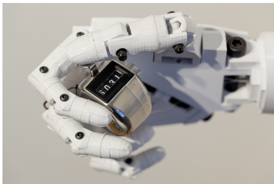
Varvara & Mar, Humans Need not to Count , 2017

Les décisions sont issues de processus cognitifs complexes. Les envisager collectivement, quand elles engagent nos devenirs partagés, les rend rien moins que cruciales. Mais voilà que, de plus en plus, nous intégrons les machines dans de tels processus au travers d'algorithmes qualifiés de décisionnels. Ce qui n'est pas sans soulever des questions que les artistes savent mettre en perspective. Car l'époque que nous vivons, un simple instant au regard de la longue histoire de notre planète, est décisive considérant les choix qui s'offrent à nous pour un développement responsable de l'intelligence artificielle.