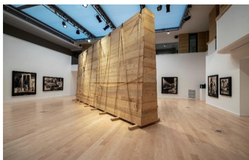
Vue de l'installation Monuments II dans l'exposition Déplacements , Centre culturel canadien, 2019.

Organisée en partenariat avec le Centre culturel canadien à Paris , cette exposition permet au public de s'interroger sur ce que représentent pour chacun de nous les œuvres d'art. Que sommes-nous prêts à faire pour protéger nos chefs-d'œuvre en temps de guerre, de crises, face à la répression et aux atteintes à la liberté d'expression ?